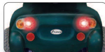
Luci "stop" posteriori